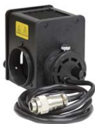
ニコン投光管 EPI-U用 12V50Wハロゲンランプハウス

ニコン投光管EPI-Uについている12V50Wハロゲンランプハウスを、LEDランプハウスLED-LHへ交換できます。