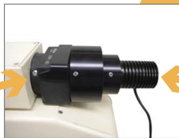
高輝度LEDランプハウス LED-LH 取付イメージ