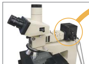
オリンパス投光管BH2-UMA用 12V50Wハロゲンランプハウス