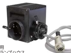
オリンパス 投光管BH2-UMA用 12V50Wハロゲンランプハウス

オリンパス顕微鏡BHシリーズの投光管BH2-UMAについている12V 50W ハロゲンランプハウスを、LEDランプハウスLED-LHへ交換できます。