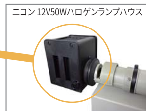
ニコン 12V50Wハロゲンランプハウス