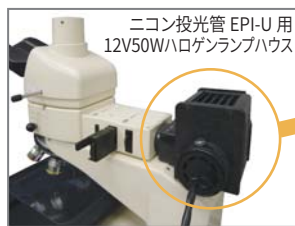
ニコン投光管 EPI-U用 12V50Wハロゲンランプハウス