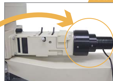
高輝度LEDランプハウス LED-LH 取付イメージ