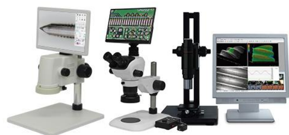
デジタルマイクロ스코プ 各種